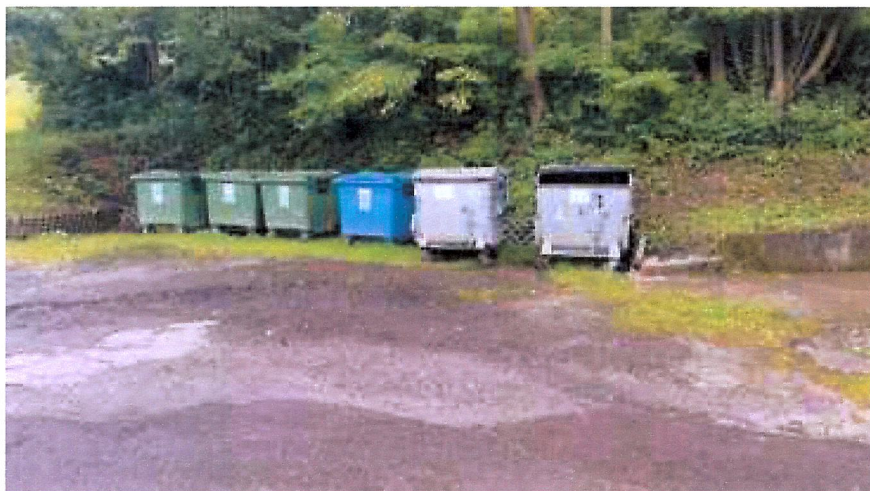
POHĽAD NA RIEŠENÉ MIESTO