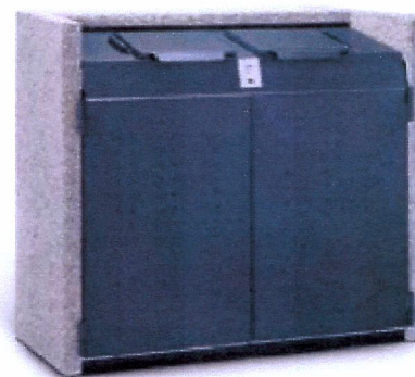
POHĽAD NA NAVRHNUTÉ KONTAJNERY